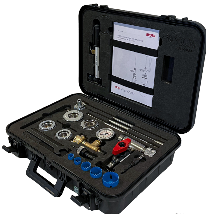
DN 15 - 50

Do nowych, zoptymalizowanych zaworów Ballomax® do wcinki na gorąco o średnicach od DN 65 do DN 100, z pełnym przełotem dostępny jest dostosowany podstawowy zestaw montażowy / zestaw uzupełniający. Oba zestawy montażowe do wcinki na gorąco stosować można do zaworów o średnicach od DN 65 do DN 100, zarówno ze zredukowanym jak i pełnym przełotem.