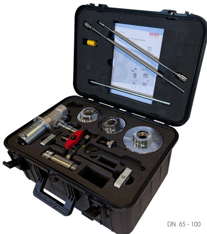
DN 65 - 100